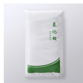
塩化アンモニウム 中国品ZZ-101