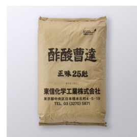
酢酸ソーダ 工業用