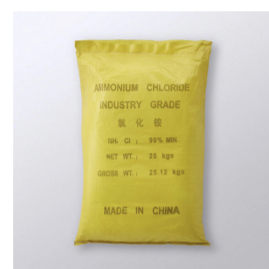
塩化アンモニウム 中国品DY-201

乾電池の製造、亜鉛メッキ、メッキ浴添加剤、鉄管接合用、染料、 鞣皮用、染色助剤、医薬品、樹脂硬化剤、食品添加用