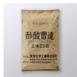
酢酸ソーダ 食添用