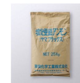
1号ヤマフラックス