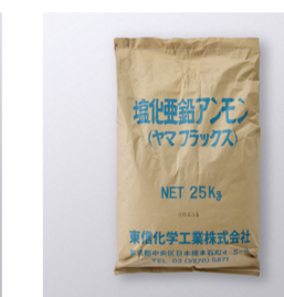
3号ヤマフラックス