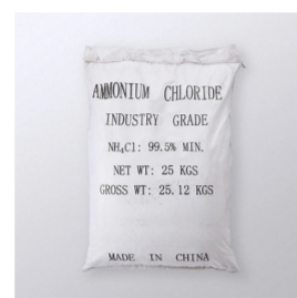
塩化アンモニウム 中国品SS-201