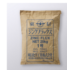
1号ジンクフラックス