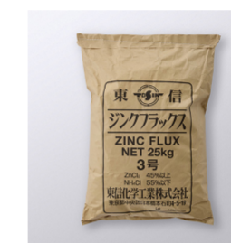
3号ジンクフラックス