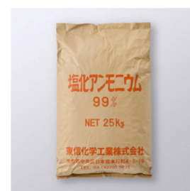
塩化アンモニウム 99% (メッキ用)